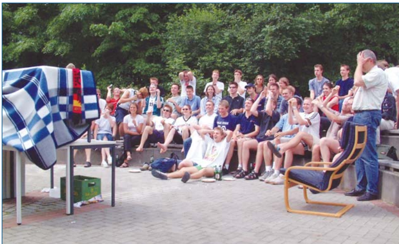
Deutschland - Irland, 91. Minute: 1:1 für Irland...

Fußball-Weltverband legt WM-Viertelfinale auf Klausurtermin