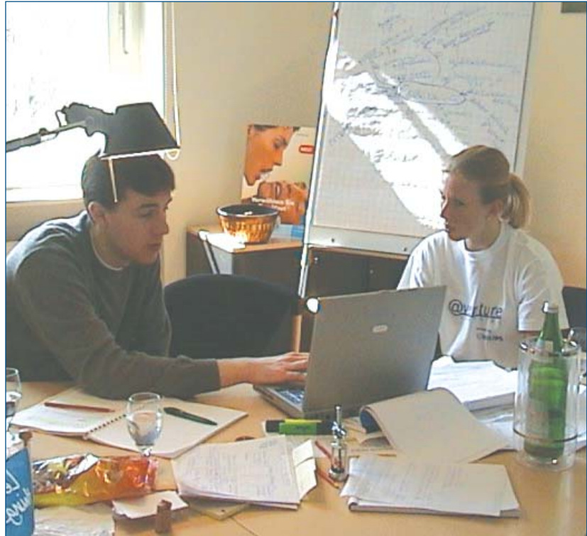
» Eine Arbeitssituation während des Workshops

Für weitere Informationen, Anregungen oder die Anforderung eines Dokumentationsvideos besuchen Sie www.venture-learning.org .