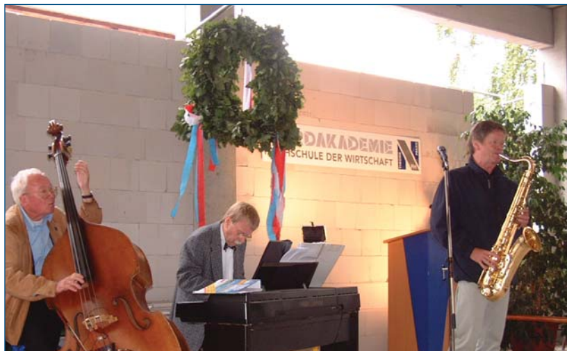
Eine Jazzband aus Elmshorn sorgte für die musikalische Untermalung des Richtfestes

Der durch die sprunghaft gestiegene Nachfrage nach Studienplätzen im Studiengang Wirtschaftsinformatik erforderlich gewordene Neubau war durch eine großzügige Spende des Arbeitgeberverbandes NORDME-