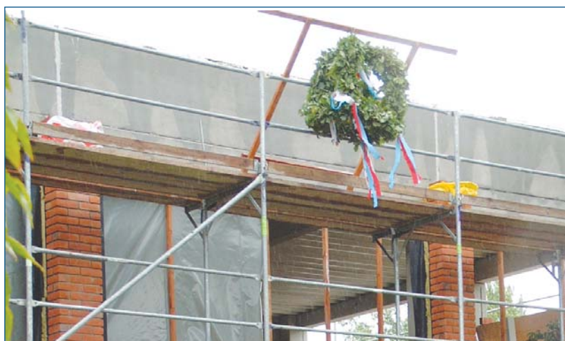
» Richtfest an der FH NORDAKADEMIE