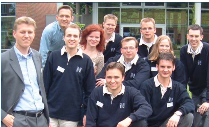
Das studentische PR-Team der FH NORDAKADEMIE

Allerdings scheint die Wahrnehmung der FH NORDAKADEMIE als konzeptioneller Vorreiter in der Öffentlichkeit weiter ausbaufähig. Das im Juni 2000 gegründete studentische PR-Team hat