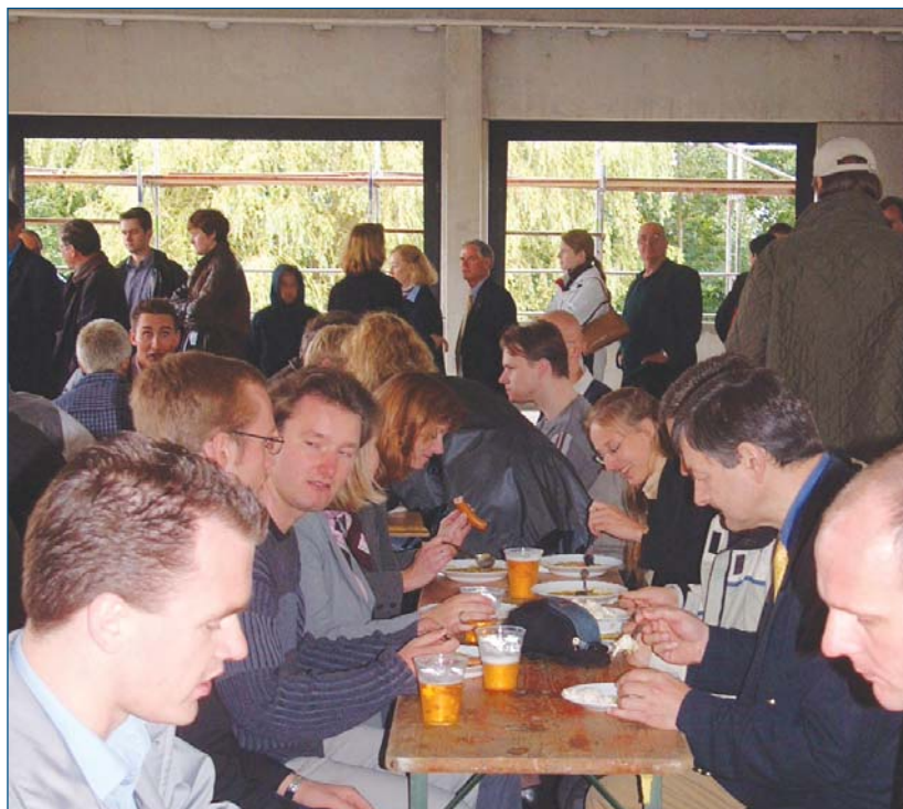
Die Gäste ließen sich Erbsensuppe und Würstchen schmecken