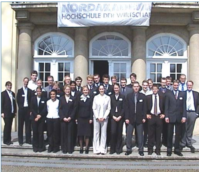
Die Teilnehmer des @venture-learning-Seminars