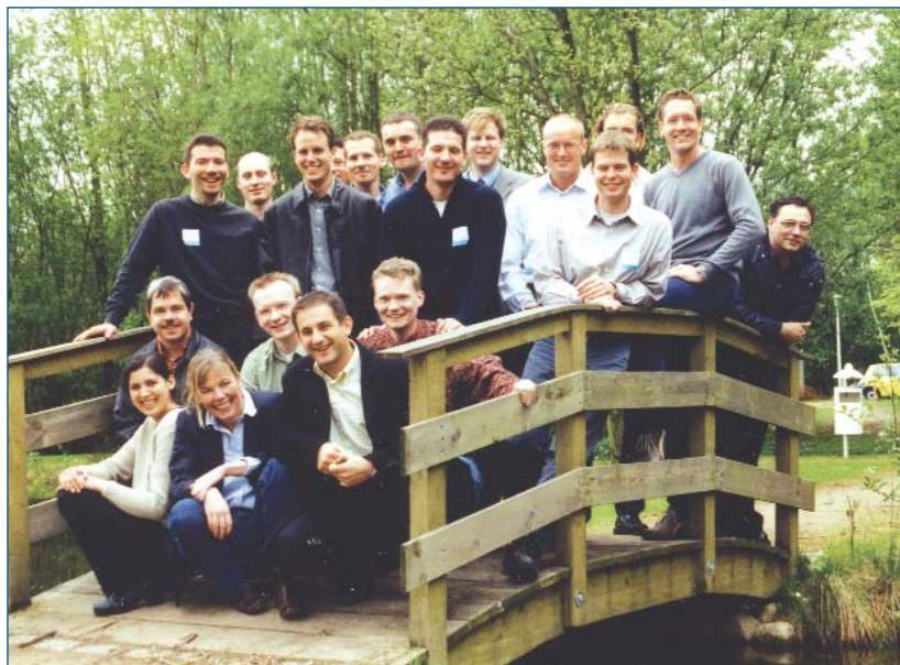
Der MBA Jahrgang 2002

Mit nunmehr vier Teilnehmerinnen hat sich der Anteil weiblicher Studierender gegenüber dem Jahrgang 2001 nur leicht erhöht. Bei einem Durchschnittsalter von etwas mehr als 32 Jahren beträgt die durchschnittliche Berufserfahrung 5,7 Jahre ab dem Studienabschluss. Bemerkenswert am neuen MBA-Jahrgang 2002 ist zudem, dass der Anteil der Studierenden mit wirtschaftswissenschaftlichen oder ingenieurwissenschaftlichen Abschlüssen etwas zurückgegangen ist. Erstmals nehmen dafür auch Absolventinnen und Absolventen