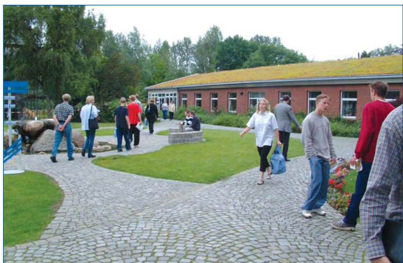
Ein Wegweiser führte die Besucher über den Campus

Mit 32 Unternehmen war die Beteiligung auf Seiten der Unternehmen noch einmal höher als im vergangenen Jahr. Darunter wieder die schon "traditionell" vertretenen Unternehmen wie BP, Tchibo, ITERGO, Dräger und Lufthansa, aber auch etliche neue Betriebe, z. B. Axel Springer Ver-