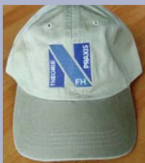
Cap und Rugby-Shirt