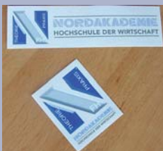
Aufkleber und Keyring