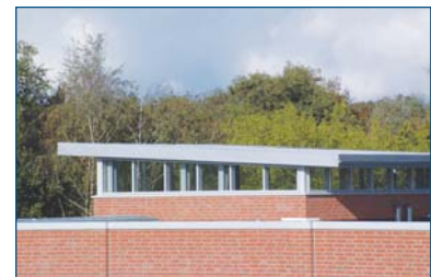
▫ Die Tower-Bar

Jetzt warten noch der Neubau und das Sportfeld auf eine Namensgebung. Der obere Teil des Treppenhauses des Neubaus, welcher turmförmig das übrige Gebäude überragt, hat diese Taufe bereits hinter sich und trägt seitdem die Bezeichnung "Tower Bar". Nur wie man diese in der Spitze des Treppenhauses befindliche "Bar" nach Wegfall des Baugerüsts erreichen kann ist noch offen. Zuzutrauen ist es unseren Studierenden, dass sie auch dieses Problem lösen können. ■