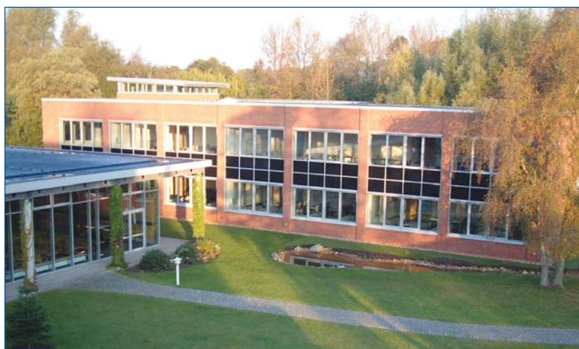
Der Neubau der FH NORDAKADEMIE (rechts)