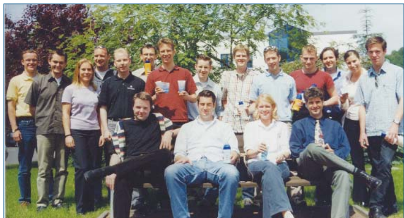
1 Die Exkursionsteilnehmer

In den drei Tagen in Sachsen entstand ein entspanntes Gruppengefühl; bei einigen vielleicht darüber hinaus auch eine etwas differenziertere Einstellung zum Osten Deutschlands und dem - im Vergleich zum hanseatischen - etwas anderen Lebensgefühl dort. Bilder, die uns in den letzten Wochen aus dieser Region erreichten, lassen die Exkursion deshalb auch rückblickend in etwas anderem Licht erscheinen. Alles in allem kann die Fahrt sicherlich als sehr rund, abwechslungsreich und absolut nachahmenswert bezeichnet werden: bieten Aktionen dieser Art doch eine optimale Ergänzung zu "normalen" Studieninhalten. ■