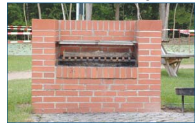
▫ Der Königsthron