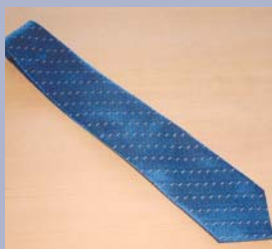
Krawatte und Halstuch