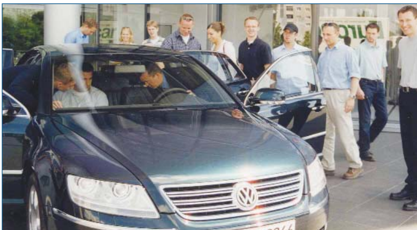
1 Der Phaeton von VW