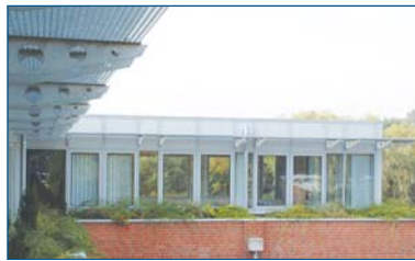
▫ Das Aquarium

seiner Kopfbedeckung aus Gras versehen, war die nächste Wortschöpfung fällig. Seitdem residiert unser Informatik- und Fremdsprachenteam nämlich im "Maulwurfshügel".