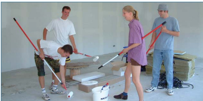
Studentinnen und Studenten der FH NORDAKADEMIE als fleißige Handwerker