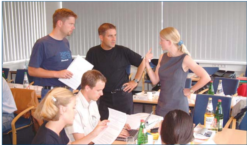
■ Eine Arbeitsgruppe des MBA-Jahrgangs 2002

Wenn Sie die Unterschiede in Kultur und Mentalität nicht kennen, wenn Sie nicht verstehen, wie Ihre ausländischen Geschäftspartner und Kollegen denken, fühlen und handeln, welche Kommunikations- und Konfliktlösungsmuster sie anwenden, dann besteht die Gefahr, dass Sie sie falsch interpretieren, krasse Fehler begehen und deshalb keinen Erfolg im Ausland haben. Alle Personen, also beispielsweise Manager,