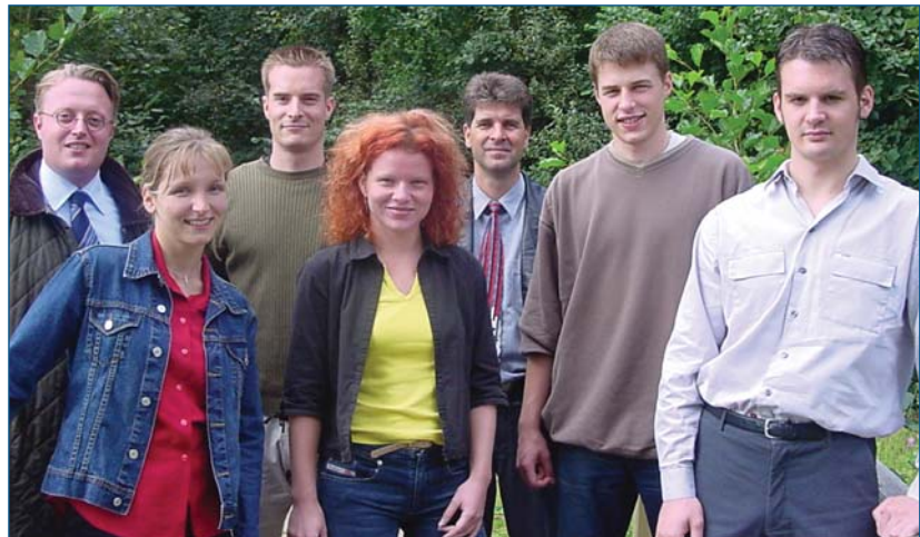
Das Merchandise Team der FH NORDAKADEMIE

In Zusammenarbeit mit dem WebTeam entstand vor gut einem Jahr ein eShop, über den die Dauerartikel bestellt werden können. Erkenntnisse aus der WebPsy-Studie, Erfahrungen mit anderen eShops und das Know-How der beteiligten Informatiker flossen mit ein und heraus kam eine praktikable Kleinlösung, die exakt auf den Bedarf des Teams zugeschnitten war. Die Resonanz der Kundschaft war durchweg positiv und diese Möglichkeit der