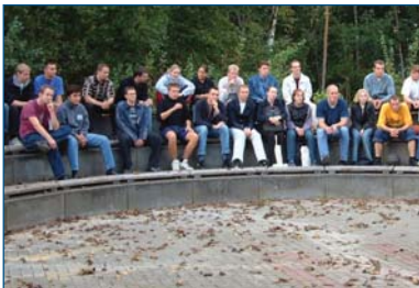
▫ Die Arena

Eigentlich sagt man es den Berlinern nach, dass sie in der Wortschöpfung zur prägnanten Kennzeichnung von Bauwerken unübertroffen sind - man denke nur an die "Schwangere Auster", mit der die charakteristische Architektur der Berliner Kongresshalle in unnachahmlicher Art beschrieben wurde. Aber auch die Mitarbeiter und Studierenden der privaten FH NORDAKADEMIE entwickeln ein hohes Maß an Phantasie, wenn es darum geht, Baulichkeiten auf unserem Campus mit treffenden Bezeichnungen zu versehen. Die erste Analogie betrifft unser kleines Vorlesungsareal im Freien. Nur kurze Zeit wurde hier von "Amphitheater" gesprochen, dann setzte sich der Begriff "Arena" durch, obwohl bis heute dort keine Gladiatorenkämpfe - auch nicht der legendäre "Kampf der Zenturien" beim jährlichen Sommerfest - stattgefunden haben.