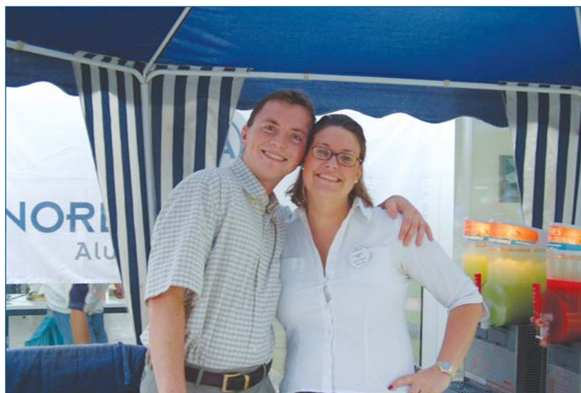
» Der Caipi-Stand des NORDAKADEMIKER e.V. auf dem Sommerfest der NORDAKADEMIE

Den ausbildenden Unternehmen an der NORDAKADEMIE bietet der NORDAKADEMIKER e.V. eine einfache Möglichkeit eine Vielzahl fachlich interessierter und qualifizierter Menschen zu erreichen. Sei es, um ein Stellenangebot zu veröffentlichen, oder einfach nur,