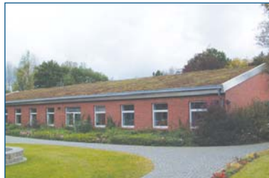
▫ Der Maulwurfshügel

seiner Kopfbedeckung aus Gras versehen, war die nächste Wortschöpfung fällig. Seitdem residiert unser Informatik- und Fremdsprachenteam nämlich im "Maulwurfshügel".