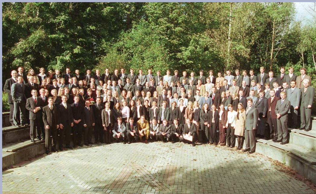
▫ Absolventinnen und Absolventen des Jahres 2002

beenden, im Studiengang Wirtschaftsingenieurwesen mit 9% am niedrigsten. Bei den Wirtschaftsinformatikern (13%) und insbesondere den Betriebswirtschaftlern (23%) ist diese Zahl deutlich höher. Nur insgesamt 5 Studierende mussten ihr Studium aufgrund einer endgültig nicht bestandenen Prüfung beenden. Die Studienabbrucherquote ist an der FH NORDAKADEMIE auch beim Jahrgang 98 noch sensationell klein. Lediglich 6% der Studienanfänger haben im Lauf des Studiums festgestellt, einen falschen Weg eingeschlagen zu haben und das Studium abgebrochen. ■