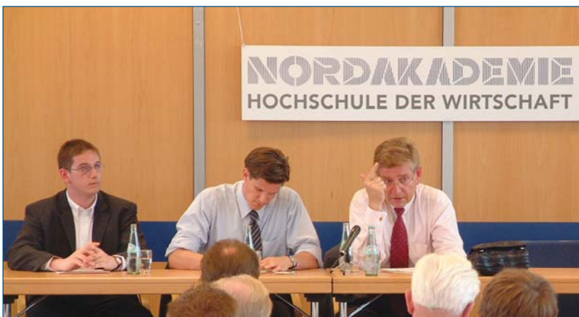
Dr. Thomas Goppel (rechts) während des Vortrags

CSU-Generalsekretär spricht in der FH NORDAKADEMIE