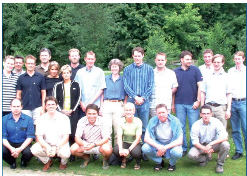
■ Die Teilnehmer des MBA-Jahrgangs 2003

Studium", so die einhellige Meinung der Teilnehmer. Das Ziel des gegenseitigen Kennenlernens sowie der Einstimmung auf das Studium wurde voll erfüllt. Seit Anfang Mai ist der MBA-2003-Jahrgang nun im Basiskurs Unternehmensführung aktiv. An jedem Wochenende lernen die Führungskräfte mit meist technischer Vorbildung die grundlegenden Methoden der Betriebswirtschaftslehre kennen und