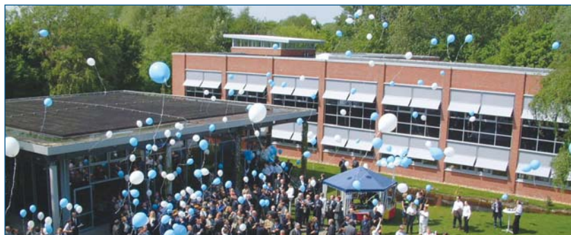
■ Der Ballonstart auf dem Campus