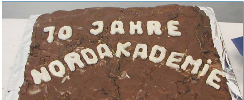
■ Die Geburtstagstorte