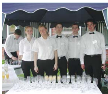
■ Das Sektteam