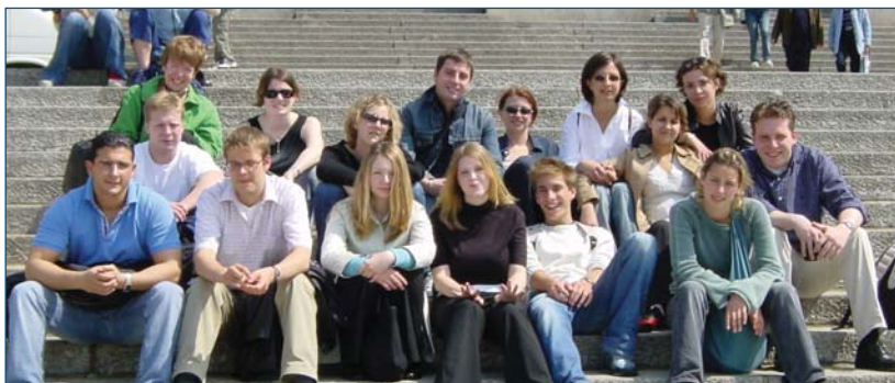
■ Die Gaststudenten mit Begleitern der FH NORDAKADEMIE in Berlin

Als besonderes Highlight stand für die Auslandsstudenten eine Berlinfahrt mit Besuch des Reichstagsgebäudes und Besichtigung des ICE-Stellwerks in Rummelsburg auf dem Programm. Der Besuch der deut-