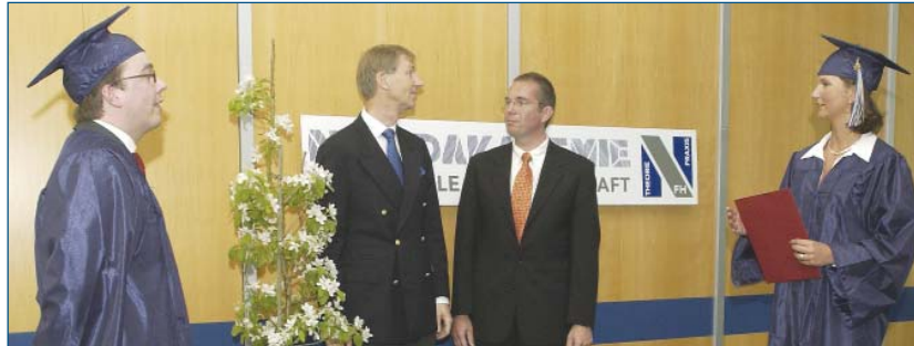
■ Die MBA-Absolventen überreichen dem Rektor und Kanzler einen Apfelbaum als Geschenk