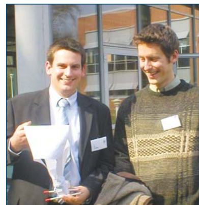
■ Zwei AC-Teilnehmer mit einem ihrer Übungsergebnisse