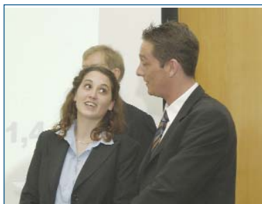
■ Die ASTA-Vorstände 2002/2003