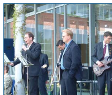
■ Die Hochschulband NAKKORD