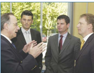
■ Die ehemaligen ASTA-Vorstände