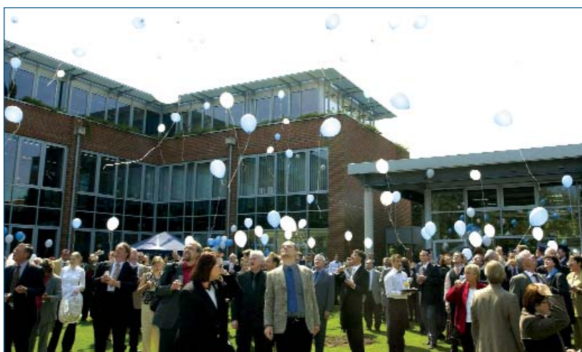
■ Die Gäste der FH NORDAKADEMIE ließen zur Feier des Tages Gasluftballons steigen